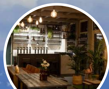
BIRRIFICIO LA VILLANA