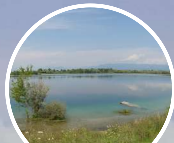
LAGO DI CAMAZZOLE

Percorso naturalistico tra Carturo, Carmignano e Camazzole