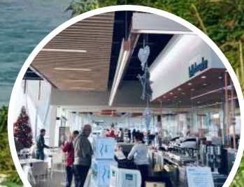
BAR BIANCO DI CAMAZZOLE