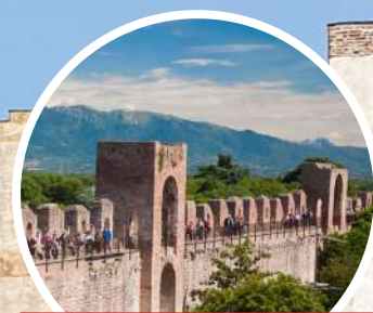
MURA DI CITTADELLA