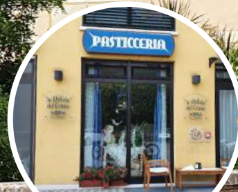
LE DELIZIE DEL GRANO