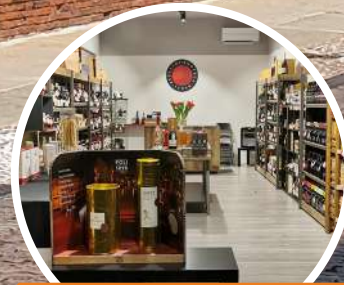
ENOTECA DEGLI EZZELINI